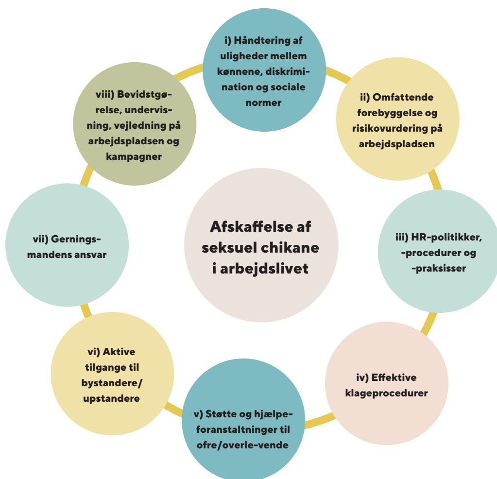
Figur 3: ASTRAPI's rammer for en transformativ tilgang til afskaffelse af seksuel chikane på arbejdspladsen

Dette afsnit gennemgår i detaljer de otte punkter i ASTRAPI-projektets ramme for en transformativ tilgang til afskaffelse af seksuel chikane i arbejdslivet (figur 3). At fremme et lige, imødekommende, værdigt og ikke-kønsdiskriminerende arbejdsmiljø bidrager til at fremme lighed mellem kønnene og ikke-diskrimination, gode arbejdspladsrelationer, teamwork mellem kollegaer og højere niveauer af innovation og tilfredsstillelse på arbejdspladsen.