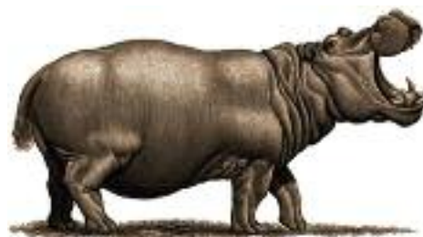
Illustration fra LO's pjeces: Luk lige løngabet. www.loli.dk