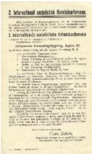
Indbydelse med dagsorden til den 2. internationale socialistiske kvindekonference i København 1910.

Til støtte for kampen for stemmeretten fremlagde Clara Zetkin et resolutionsforslag med følgende ordlyd: