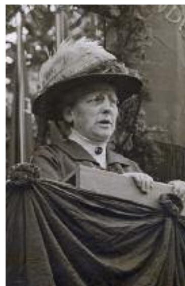
Nina Bang (1866-1928), historiker, senere undervisningsminister 1924-26. Her på talerstolen i 1920.

På konferencen var der nogen uenighed om, hvordan kravet om stemmeret skulle være, men flertallet kunne til sidst gå ind for almindelig stemmeret til alle kvinder, dvs. at alle kvinder uanset økonomisk baggrund skulle have ret til at stemme.