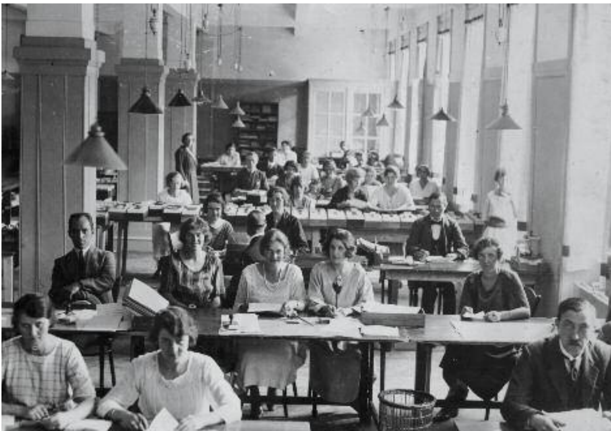
Den kommunale københavnske hjælpe-kasses kontor i Bernstorffsgade 1922. En kvindearbejdsplads.

”regulering af den kvindelige arbejdskraft”. Det blev dog i lovene lavet om til: ”samme løn for lige arbejdsydelse af mandlige og kvindelige medhjælpere.” Ligeløn blev en fælles sag.