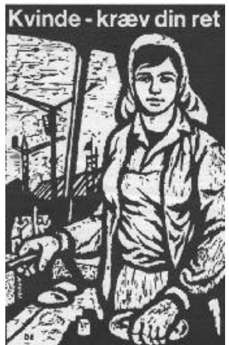
Forside af pjese fra DKP 1977.

Slutningen af 2. verdenskrig markerede overgangen til en ny tid. På Kvindeligt Arbejderforbunds kongres i 1945 var kravet om ligeløn et af de gennemgående temaer. Kongressen besluttede, at kravet skulle stilles ved de næste overenskomstforhandlinger. Også inden for de blandede forbund som bryggeriarbejdere og tobaksarbejdere var der i årene efter krigen en debat om ligeløn. Det blev dog først i 1952, at det lykkedes at få ligelønnen med som et af LO's generelle krav ved overenskomstforhandlingerne. Arbejdsgiverne afviste totalt kravet, men gik dog med til, at der blev nedsat et udvalg mellem LO og DA, der skulle arbejde med sagen. Og det gjorde de så de næste 20 år, selv om kravet