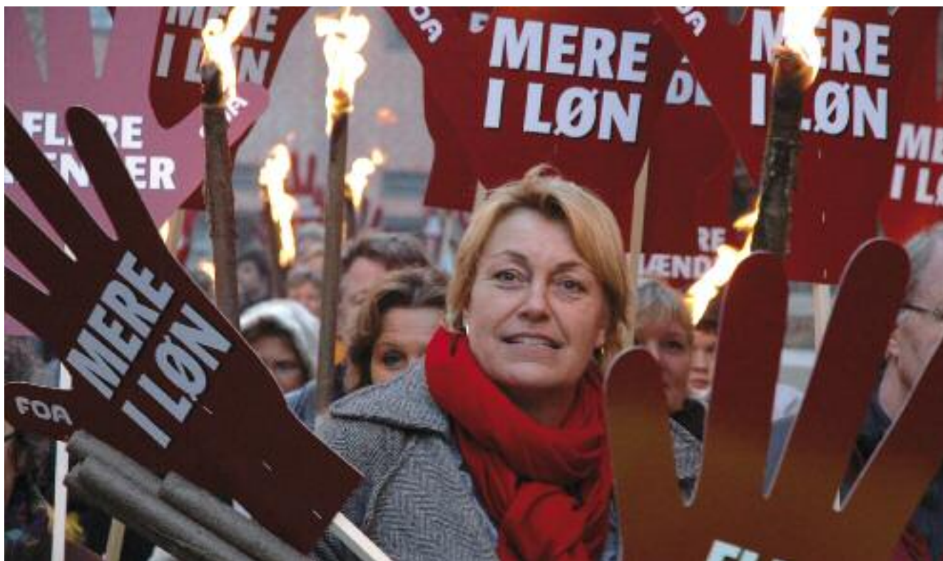
FOA medlemmer demonstrerer for mere i løn under overenskomststrejken i 2008.

Overenskomstforhandlingerne indenfor industrien i 2010 resulterede i et forslag, hvor ligeløn mellem kvinder og mænd indgår: