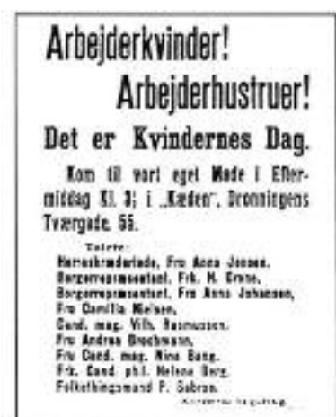
Løbeseddel om møde på kvindedagen 3. marts 1912.