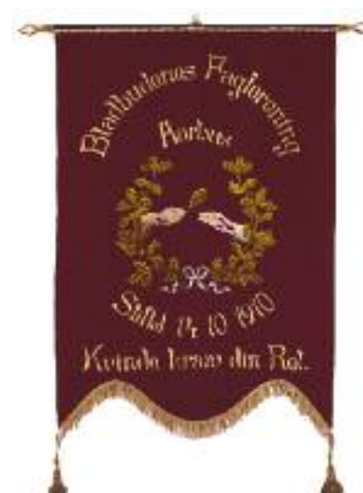
Fane for Bladbudenes Fagforening.