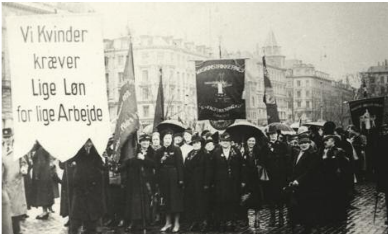
Kvindeligt Arbejderforbund afdeling 5 (jernpigerne) i strejke for lige løn, 1930. Som det ses, er kravet om lige løn for lige arbejde ikke noget nyopfundet.