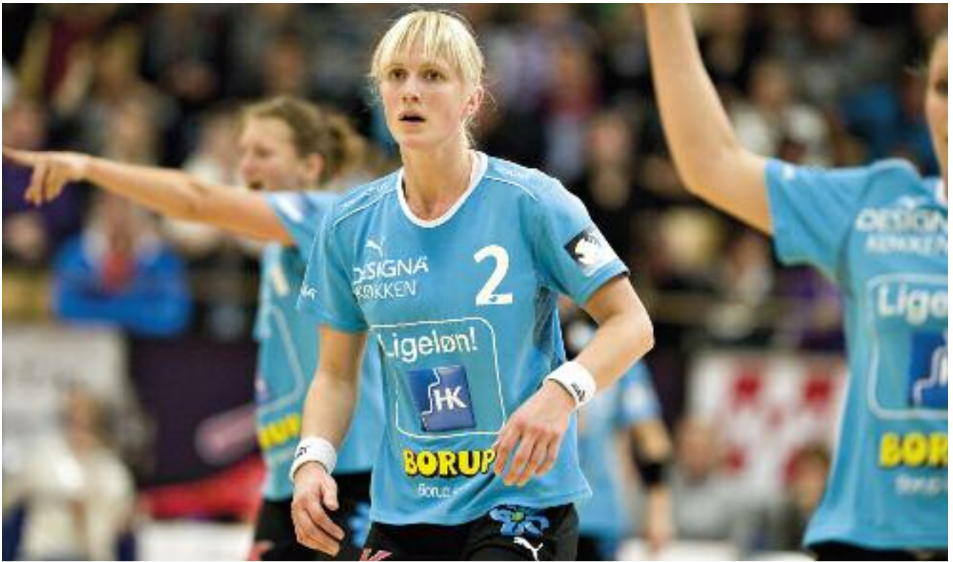
Bolden er givet op for ligeløn. Viborg HK møder Leipzig i Viborg Stadionhal d. 31.okt. 2009.

lønforhøjelse, de havde krævet, men tilsluttede sig et forlig på 13,4%, som dog er et af de bedste overenskomstresultater i mange år. Hvad der sikkert vil få stor betydning i fremtiden er, at FOA's medlemmer satte uligelønnen på dagsorden, og de viste, at de var parate til at strejke for at få resultater. Dette fik de strejkende stor opbakning til i befolkningen, selv om mange blev ramt i deres dagligdag. Danskerne markerede, at de ønsker et velfungerende velfærdssamfund, hvor medarbejderne får en ordentlig løn for det samfundsnødvendige arbejde, de udfører.