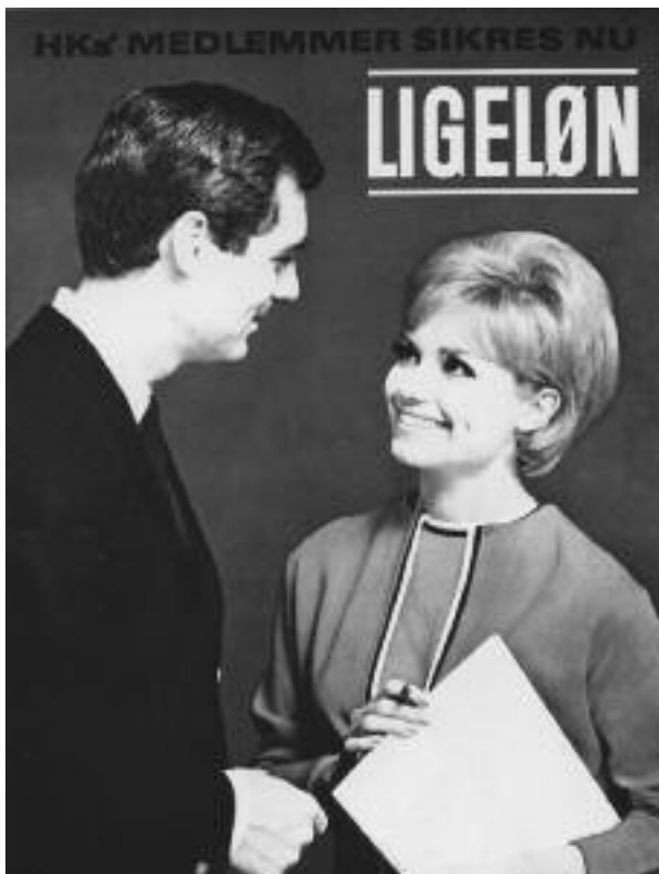
Tv.: HK plakat med teksten: "HK's medlemmer sikres nu ligeløn". Ligeløn blev indført i HK's overenskomster fra 1963.