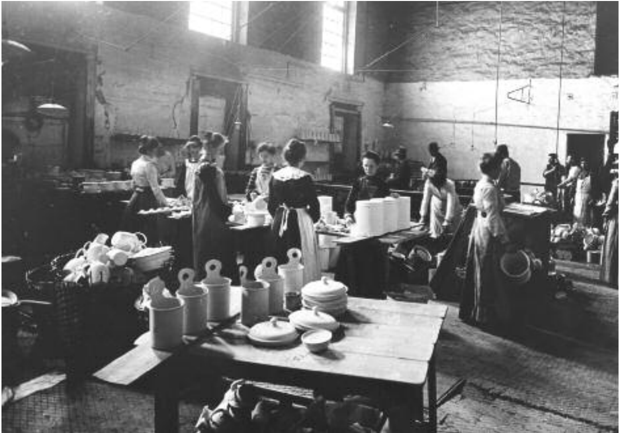
Kvindelige arbejdere på Glud & Marstrand ca. 1915.