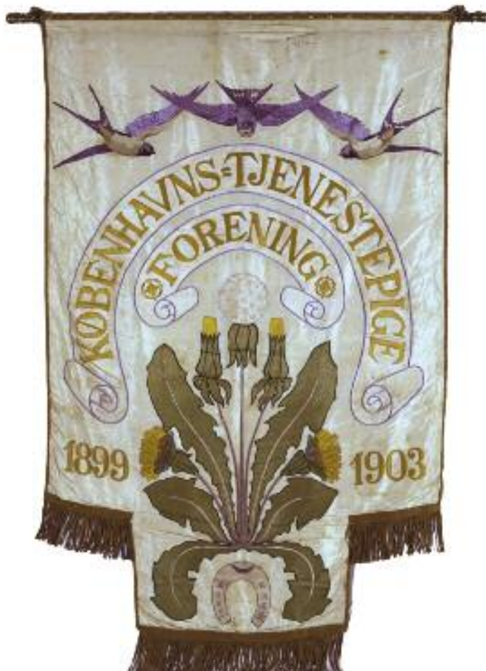
Københavns Tjenestepigeforenings fane fra 1903.

Stemmeprocenten for kvindelig deltagelse var ved folketingsvalget i 1918 67,6% mod mændenes 84,0%, men allerede ved folketingsvalget i 1920 var kvindernes valgdeltagelse steget til 72,2% mod mændenes 82,2%.