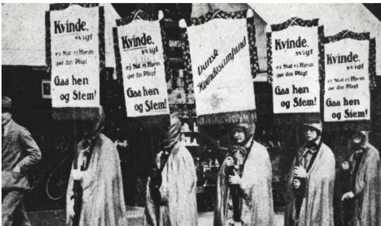
Aktivister fra Dansk Kvinde-samfund opfordrer kvinder til at stemme, 1918.