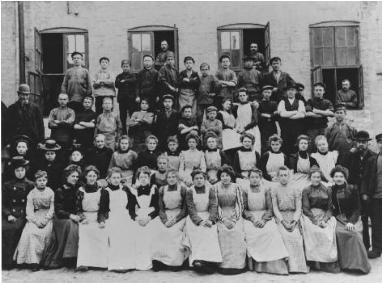
Ansatte på Randers tændstiks-fabrik, 1901. Kvinder og børn udgjorde de fleste af fabrikkens arbejdere.

"Da Landstinget formener, det hverken vil være i kvindernes eller i samfundets interesse, at der tildeles dem valgret, gaar det over til dagsordenen"