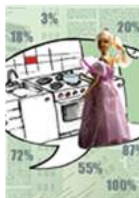
Illustration fra LO's site om ligeløn: www.loli.dk

I 2010 næsten 40 år efter at ligeløn blev indført i overenskomsterne i Danmark, beregner arbejdsmarkedsforskere stadig løngabet mellem mænd og kvinder til at være ca. 18-19%. Et tal der ikke har ændret sig de sidste 20 år. Undersøgelser viser, at den væsentligste årsag til løn-