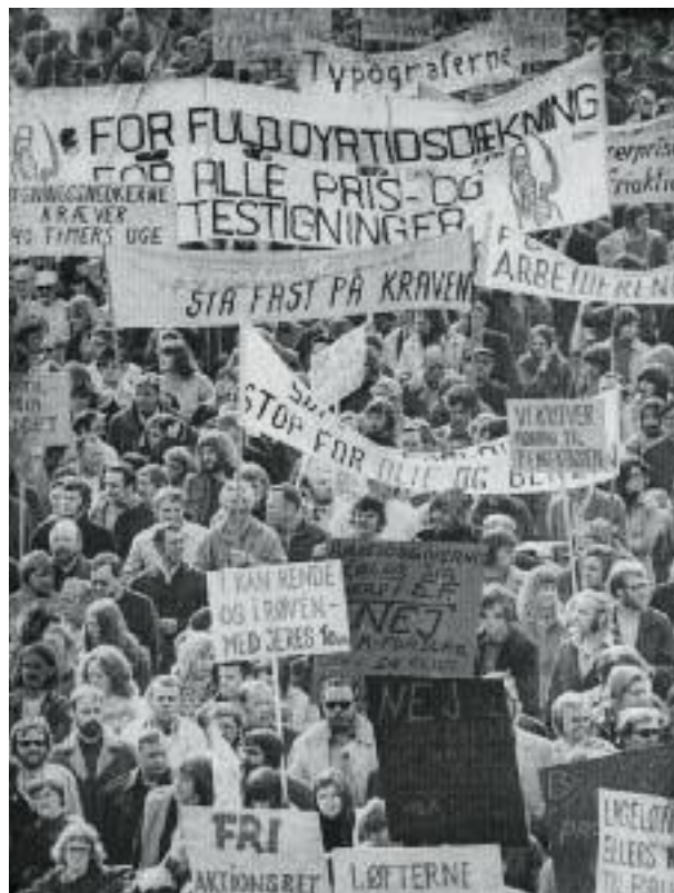
Th.: Demonstration foran forligsinstitutionen under overenskomststrejken i 1973.

blev rejst ved de fleste overenskomstforhandlinger. Arbejdsgiverne synspunkter var: At ligeløn var omkostningsfordyrende og konkurrencefordrivende, og de frygtede, at hvis ligelønnen blev indført på akkordlønnen, som det i første omgang var hensigten, ville ligelønsprincippet brede sig ud over hele arbejdsmarkedet. Arbejdsgiverne havde ikke til hensigt at opgive et lukrativt kønsopdelt arbejdsmarked, der på virksomhedsniveau gav dem muligheder for at bestemme et arbejdes pris og køn og bruge lønforskellene til at spille arbejdergrupperne ud mod hinanden.