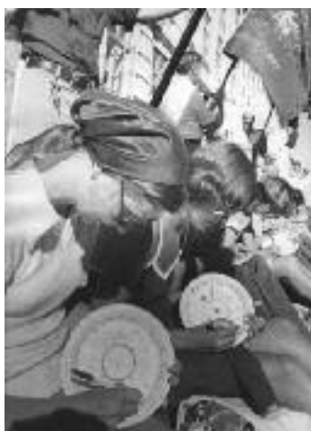
Porcelænsarbejdere demonstrerer, 1976.