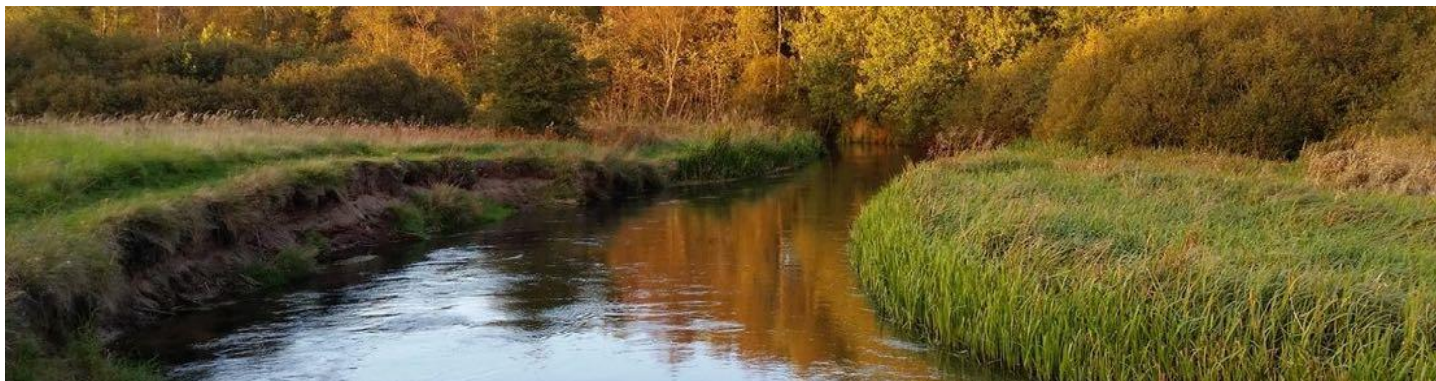
KURSET AFHOLDES UNDER UTRADITIONELLE RAMMER VED KARUP Å OG EN TUR I KANO GENNEM ÅDALEN ER EN DEL AF PROGRAMMET.

Vi vil gå tæt på hinanden som mennesker, mænd og tillidsrepræsentanter i dialog og samspil og derved lære mere om hvad det vil sige at stå sammen og at hjælpe hinanden igennem udfordringer.