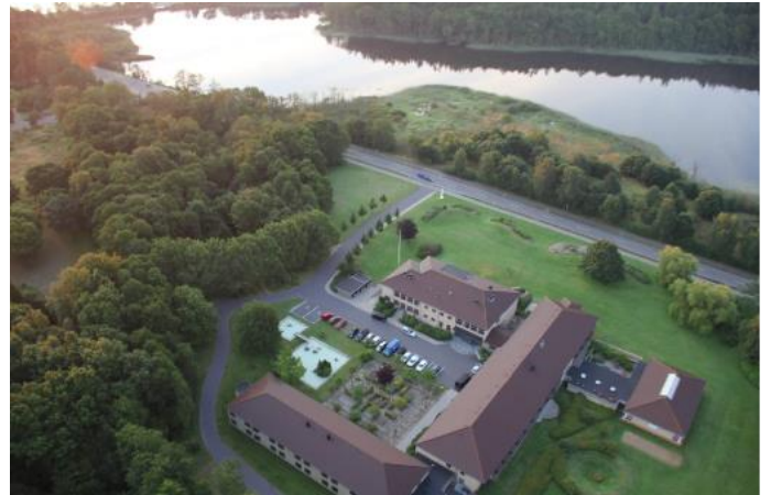
3F'S KURSUSCENTER - LANGSØHUS

Tillidsvalgte mænd der ønsker at gøre en ekstraordinær indsats for den gode arbejdspladskultur.