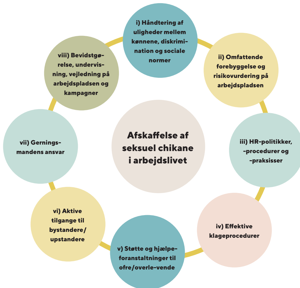
Figur 3: ASTRAPI's elementer for en transformativ tilgang til afskaffelse af seksuel chikane på arbejdspladsen