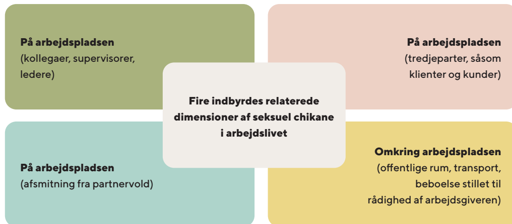
Figur 1: Seksuel chikane i forskellige områder af arbejdslivet

Arbejdslivet omfatter ikke kun den fysiske arbejdsplads, men også de offentlige og private rum, der knytter sig til, hvor arbejde udføres, fx hvor en arbejdstager holder hvilepause, indtager et måltid eller bruger sanitære faciliteter eller baderum; beboelse stillet til rådighed af arbejdsgiveren; pendling til og fra arbejde; arbejdsrelaterede ture eller rejser, undervisning, efteruddannelse, arrangementer som personalemøder eller sociale aktiviteter; og arbejdsrelateret kommunikation via e-mail eller cloud-arbejde (via internettet). Seksuel chikane og seksuelt krænkende adfærd kan forekomme i alle afskygningerne af arbejdslivet.